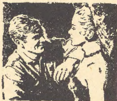
VAN HEFLIN-TAB HUNTER KATHRYN GRANT-JAMES DARREN