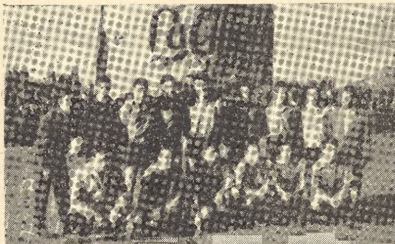
Equipo que ha llevado a Priego a 3.ª División

—Sí, deseo hablar de los bonos. Con objeto de hacer más fácil para todos la adquisición del carnet, se pondrán a la venta a primeros de Agosto unos bonos a 25 ptas. con los que creemos que aumentará el número de socios.