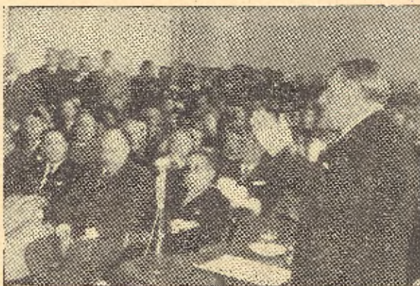
Habla el nuevo académico

Bien entrada la noche entramos en Córdoba bordeando las viejas murallas, y al disponernos a escribir esta crónica anotamos, para que no quedase envuelto en las brumas del olvido, algo que sería imperdonable: expresar nuestra gratitud a los señores de Gámiz Valverde, por las finas atenciones que dispensaron a INFORMACIONES en nuestra humilde persona.»