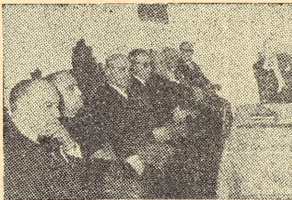
Fragmento de la Presidencia