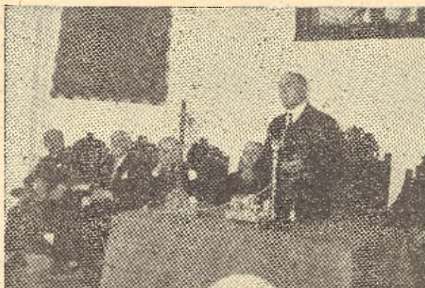
Discurso del Director de la Real Academia