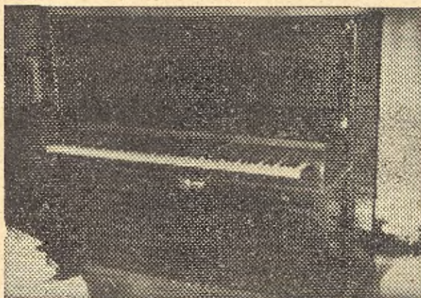
Con la melancolía de las cosas cargadas de recuerdos el piano de Falla lleva en sus teclas uno de los capítulos más gloriosos de la música española.

Creo que lo que ambos nos puedan decir—especialmente el primero, cuya amistad con el músico fué siempre íntima y duradera—, es mucho más inte-