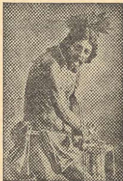
Ntro. Padre Jesús en la Columna

A veces, la procesión es nutrida, numerosa: con su banda de tambores, (póstuma elevación a tal musical dig-