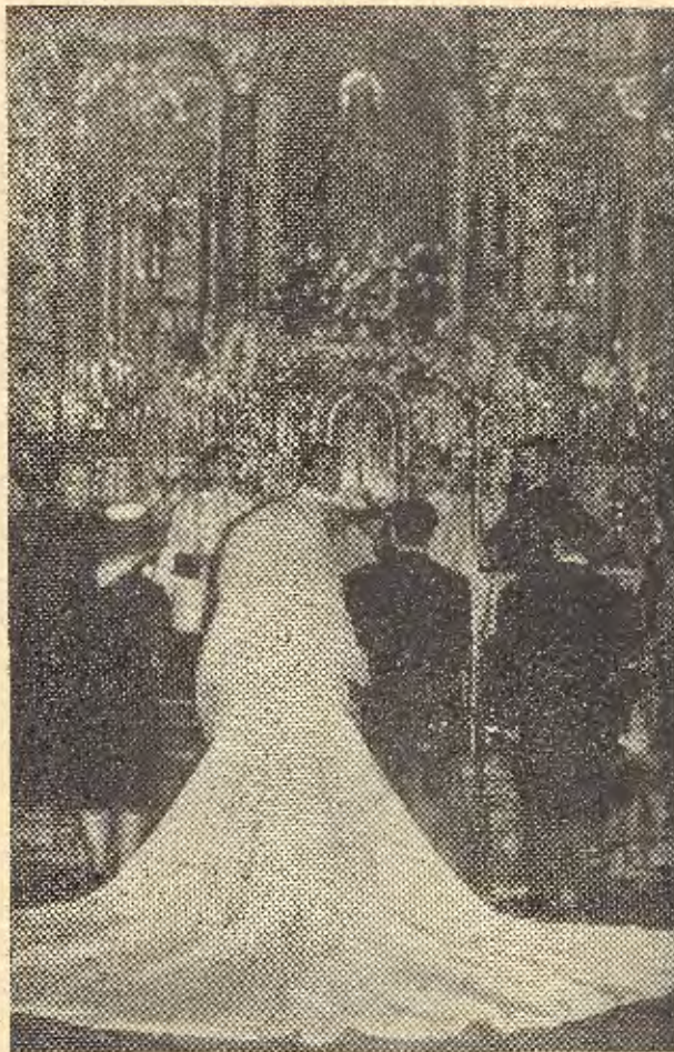
Novios y padrinos en la ceremonia religiosa