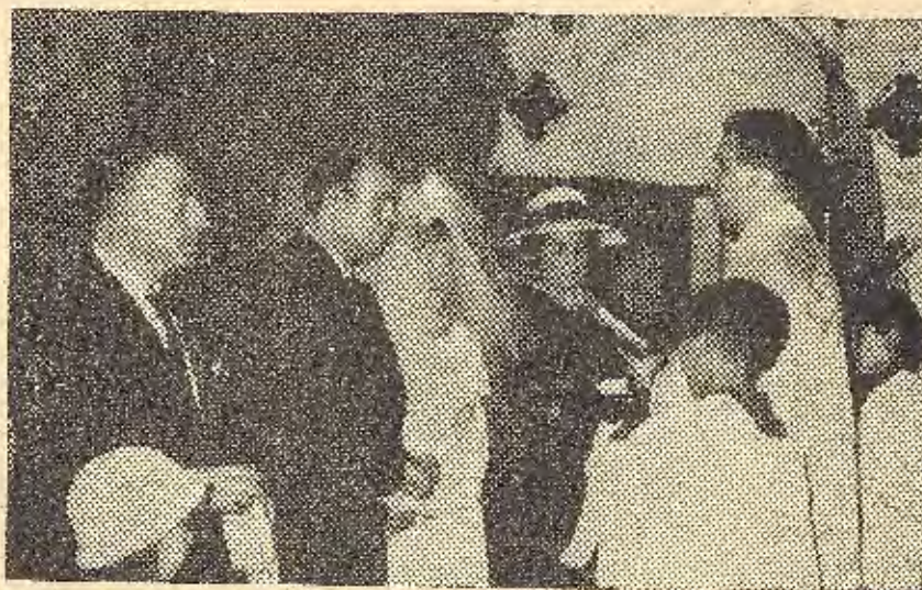
Un momento de la ceremonia religiosa