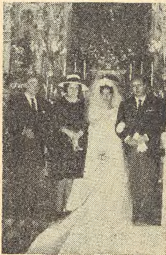
El nuevo matrimonio y padrinos ante el Altar Mayor