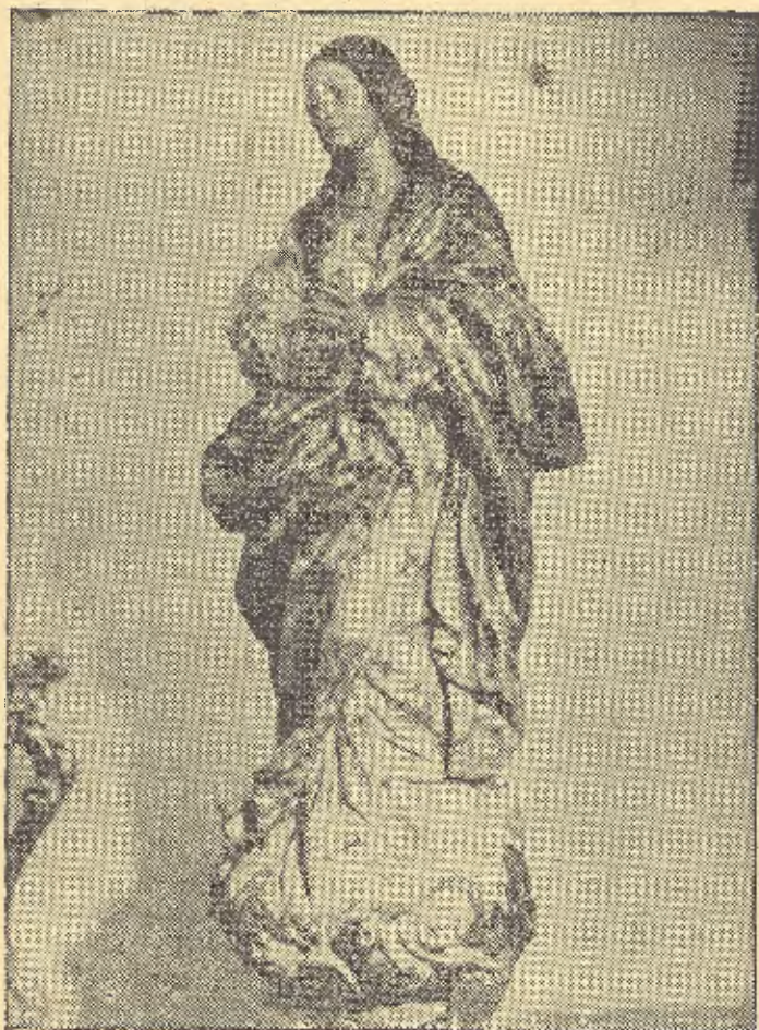
Talla de la Inmaculada Concepción, Patrona de Priego que se venera en el templo de San Pedro

El día 8, a las doce de la mañana, habrá solemne función religiosa en su honor, con asistencia del Excmo. Ayuntamiento pleno