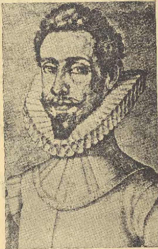
Retrato dibujado por Pacheco (Museo Lázaro Galdiano)

Y es que la escena española, iniciada en los últimos siglos de la Renonquista, modificada en orden a su perfección por Juan de la Encina y Torres Naharro, asentada más tarde sobre nuevas bases por el sevillano Lope de Rueda, alcanza con Lope de Vega el pináculo de su esplendor. No son ya los llama-