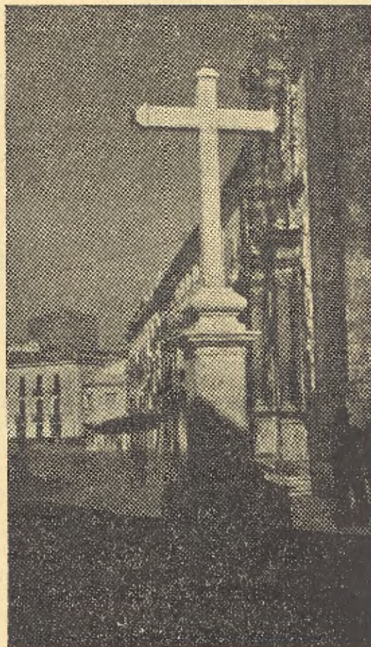
Cruz de la Aurora, junto al templo de San Nicasio