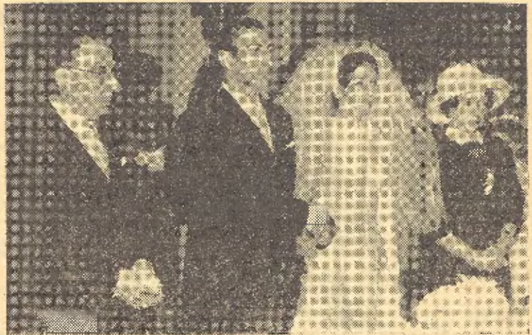
Un momento de la ceremonia religiosa