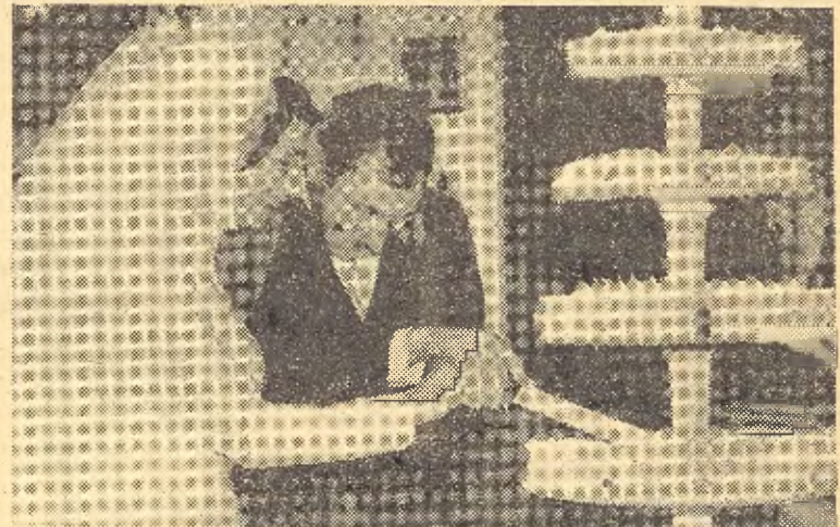
Los novios parten la tarta nupcial

pone el autor de manifiesto el gran fracaso de los padres que pretenden educar sin poner en práctica lo que predicán. Ya en el prólogo nos dice que su libro está escrito para padres, educadores, sacerdotes y para todos aquellos que, directa o indirectamente, tienen que dictaminar, aconsejar, opinar y decidir en el delicado y complejo mundo de los jóvenes. Pero sobre todo lo escribe "para los que hablan de una manera y viven de otra, para los que mienten delante de sus hijos a título de educarlos, para los que aún no han comprendido que un pequeño juez alienta en cada uno de sus hijos, para los que se apuntan los triunfos de la educación y cargan a la cuenta de los muchachos los fracasos, para los que confunden esta vida con una película de buenos y malos, para los que juzgan sin ser jueces, para los que condenan sin escuchar a la defensa, para los que creen que pueden pasar por santos siendo pecadores, para los padres ciegos, para los padres ingenuos, para los padres hipócritas..."