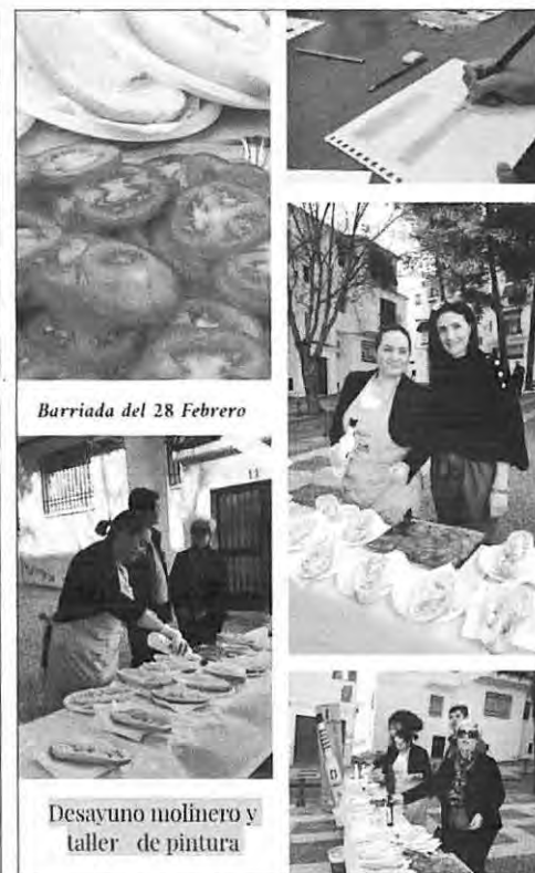
Barriada del 28 Febrero