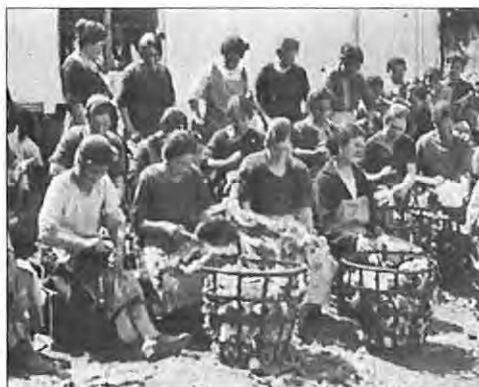
Fábrica de sombreros San Luis

En todos los casos a lo largo de la historia, queda evidente, siempre que hay datos, una segunda discriminación (la primera como hemos visto era la imposibilidad de acceder a puestos técnicos o directivos) que sufría la mujer: la de cobrar distintos sueldos por el mismo trabajo. Ya en el citado informe de 1904 consta que a los hombres se les pagaba un jornal de 1,5 pesetas mientras que a las mujeres se les pagaba 0,75 pesetas, es decir, la mitad. Medio siglo más tarde, en algunas tablas comprobamos cómo un tejedor cobra 31,76 pesetas/día mientras que en la misma empresa una tejedora con los mismos telares a su cargo cobra 28,61 pesetas diarias. La diferencia puede llegar a ser de 39 a 30 pesetas y encontramos el caso de un aprendiz que cobra 21 pesetas diarias mientras que